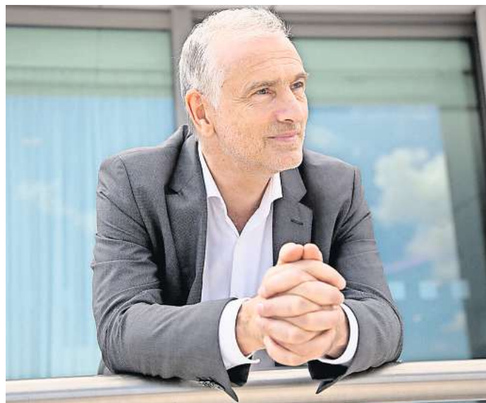
Dirigent Stefanos Tsialis hat schon mit fast 90 internationalen Orchestern gearbeitet.

Eröffnet wird der Konzertabend mit der d-Moll-Sinfonie von César Franck (1822-1890), einem der wohl originellsten und ungewöhnlichsten Komponisten des 19. Jahrhunderts, der als Vorreiter des Impressionismus gilt. Der französische Komponist wirkte ab 1846 als Organist an verschiedenen Pariser Kirchen, ab 1858 ausschließlich an der Kirche Sainte Clotilde. Er begründete mit seinen Werken für die Orgel die neue französische Schule, die sich durch einen polyphonen, mehrstimmigen Stil auszeichnete. Seine bekanntesten Werke entstanden erst im letzten Jahrzehnt seines Lebens.